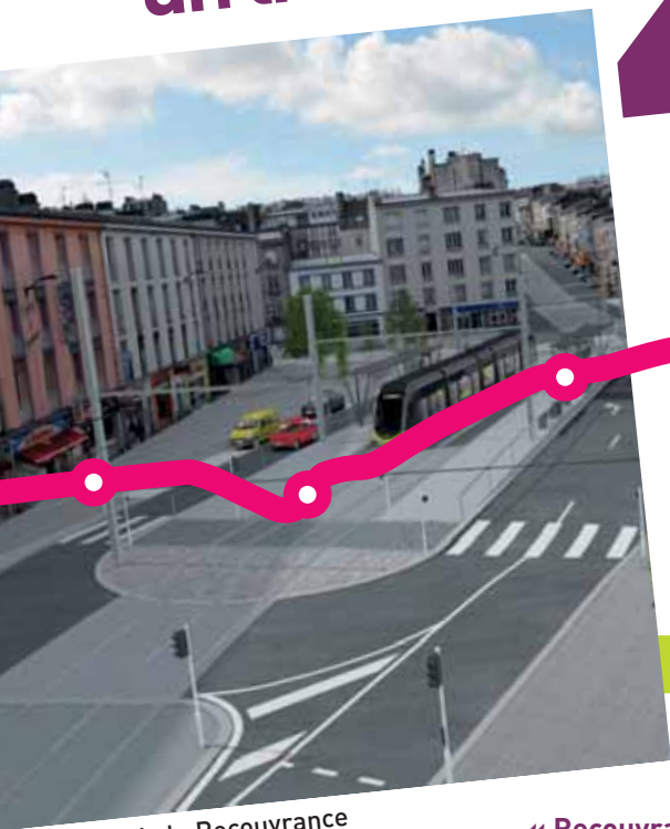
Place de la Recouvrance