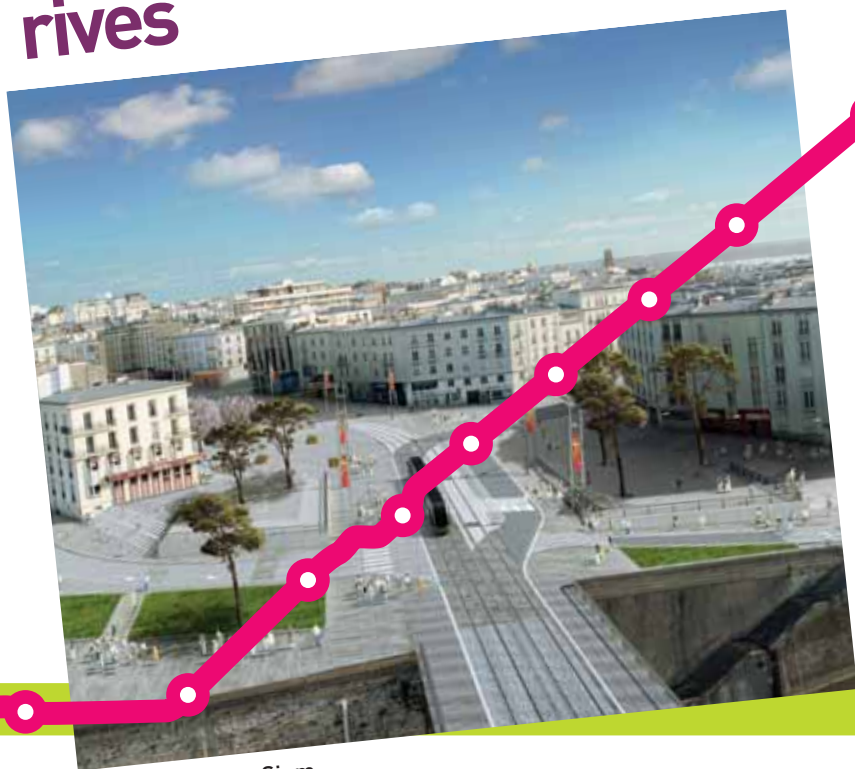
Bas de la rue de Siam